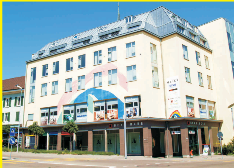
Bequem erreichbar im 1. Stock des Postmarkts (mit Lift und eigenem Parking) befindet sich das Wohnparadies für gesunde Funktionalität!

Wird der Rücken richtig gestützt oder führen Haltungsfelder zu Verschleiss und Schmerzen? Das Ergebnis dieser Prüfung ist ein einzigartiges Sortiment von Polstergarnituren, Relax-Sesseln, Büromöbeln, Betten und Matratzen, die garantieren, dass der Körper stets eine optimale Haltung einnehmen kann. Diese gesunde Funktionalität bietet beste Voraussetzung fürs Wohlbefinden zu Hause und bei der Arbeit.