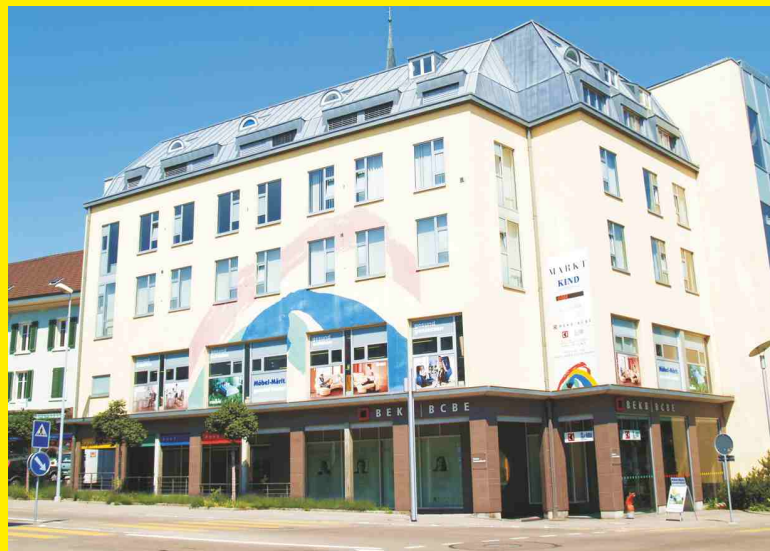
Bequem erreichbar im 1. Stock des Postmarkts (mit Lift und eigenem Parking) befindet sich das Wohnparadies für gesunde Funktionalität!

Seit 20 Jahren sind Komfort, Design und Wohnlichkeit selbstverständliche Kriterien bei der Gestaltung des Sortiments im Möbel-Märit. Inhaber Stefan Mumenthaler ist aber auch der Gesundheitsaspekt eines jeden Möbelstücks wichtig. Dabei wird kritisch durchleuchtet, ob sich ein Möbel dem Körper anpassen lässt oder nicht. Kann sich der Körper entspannen oder neigt er zum Verkrampfen?